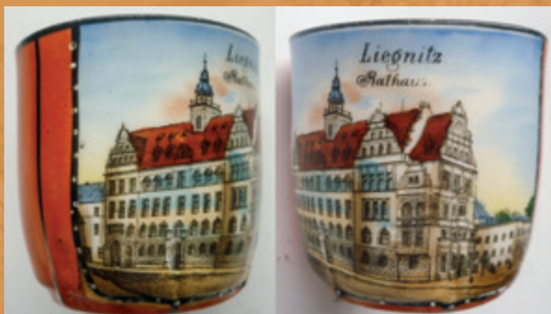
▲ Okolicznościowy kubek z wizerunkiem Nowego Ratusza.

Prezydent rejencji legnickiej Günther von Seherr-Thoß wręczył order i odznaczenia osobom zasłużonym przy budowie. Następnie zgromadzeni w uroczystym przemarszu udali się do nowego gmachu. Uczestnicy pochodu, w ściśle określonym porządku, z prezydentem rejencji i nadburmistrzem na czele, przeszli przez Rynek, pasaż Piotra i Pawła i weszli do budynku Nowego Ratusza od strony północnej, a następnie uda-