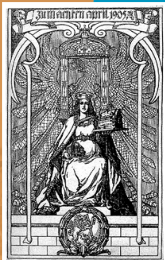
▲ Zaproszenie na bankiet z okazji oddania Nowego Ratusza zaprojektowane przez Paula Oehlmann

(Na podstawie książki Grażyny Humeńczuk „Nowy Ratusz w Legnicy. 1905-2005”)